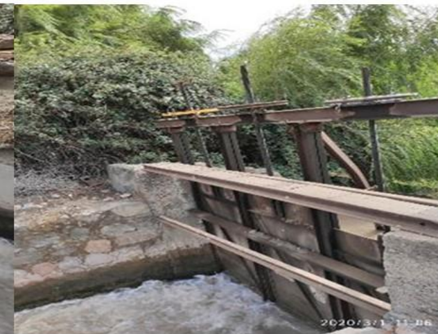
Foto 4. Canal Comunero.