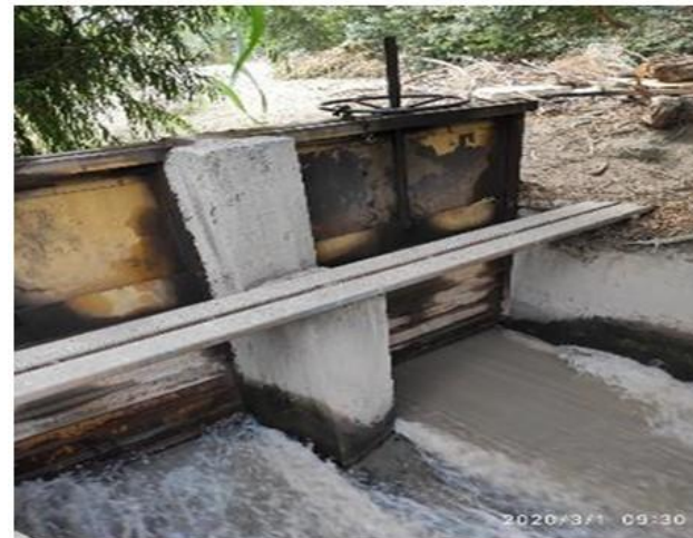
Foto 3. Canal El Cerro.