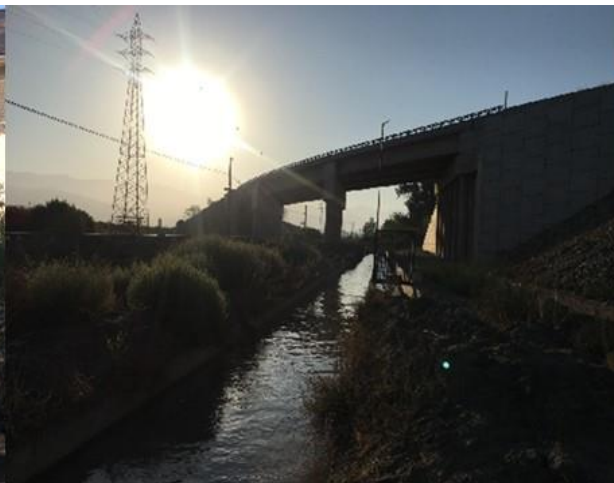
Foto 2. Canal La Pirca.