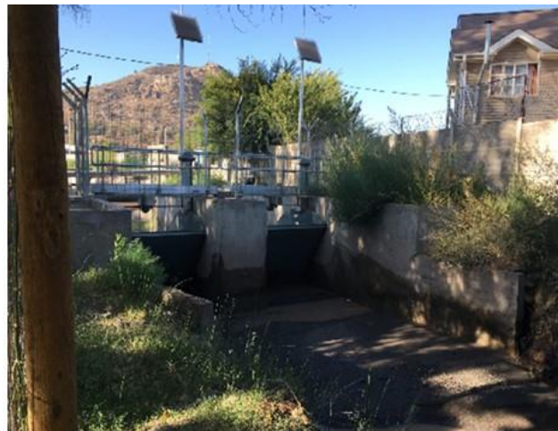
Foto 1. Canal Rinconada.